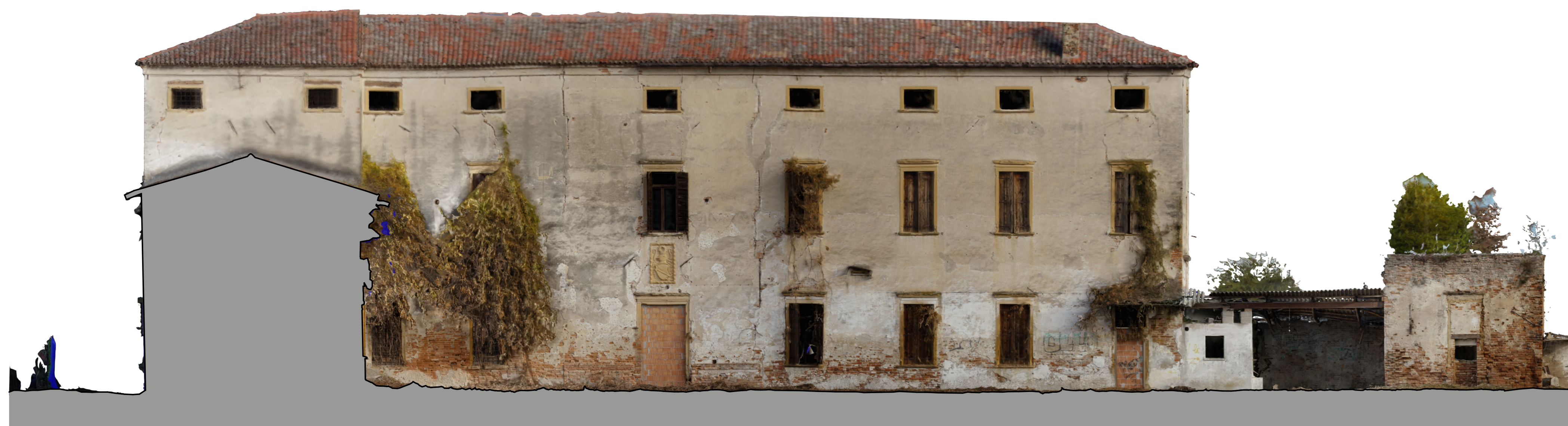
1:100 ORTOPROIEZIONE A1 ORTH001