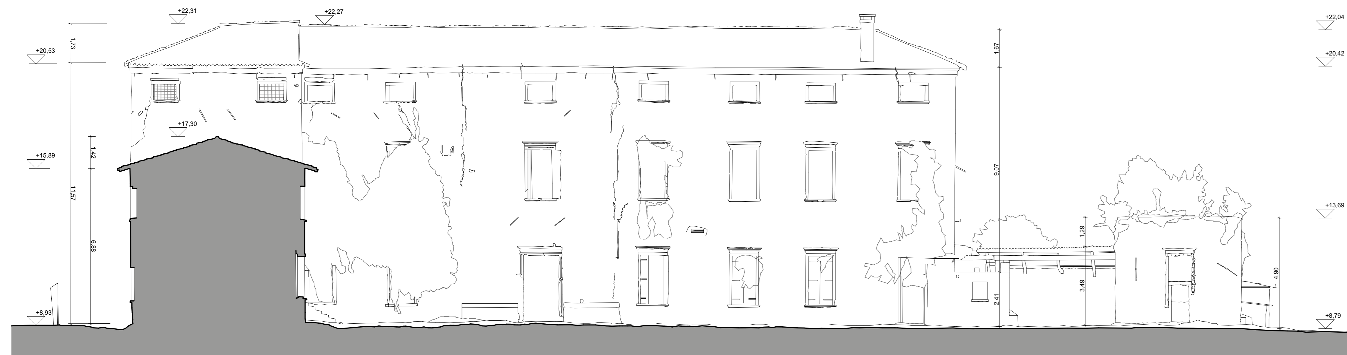
1:100 FRONTE SUD A1