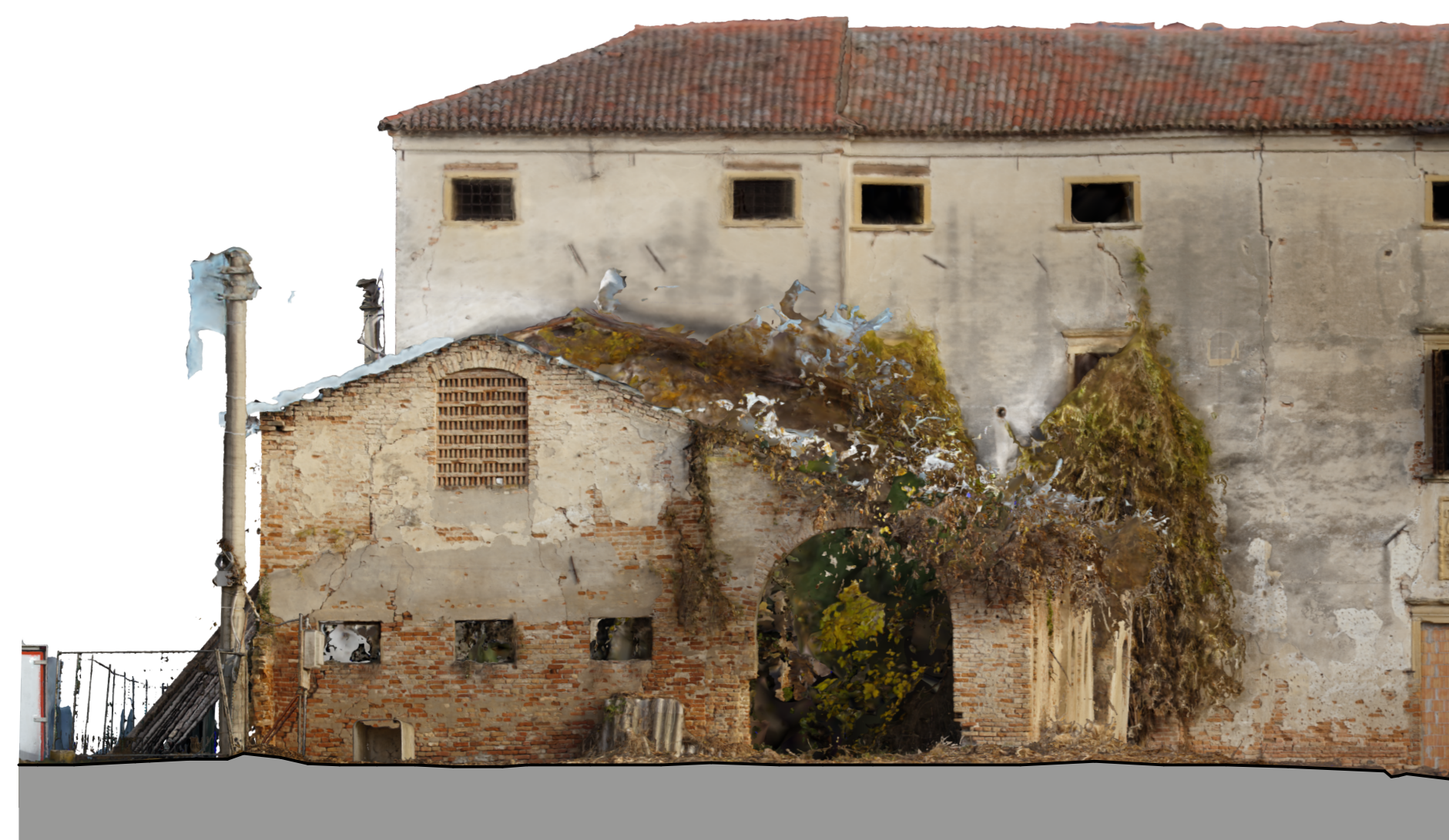
1:100 ORTOPROIEZIONE A2 ORTH002