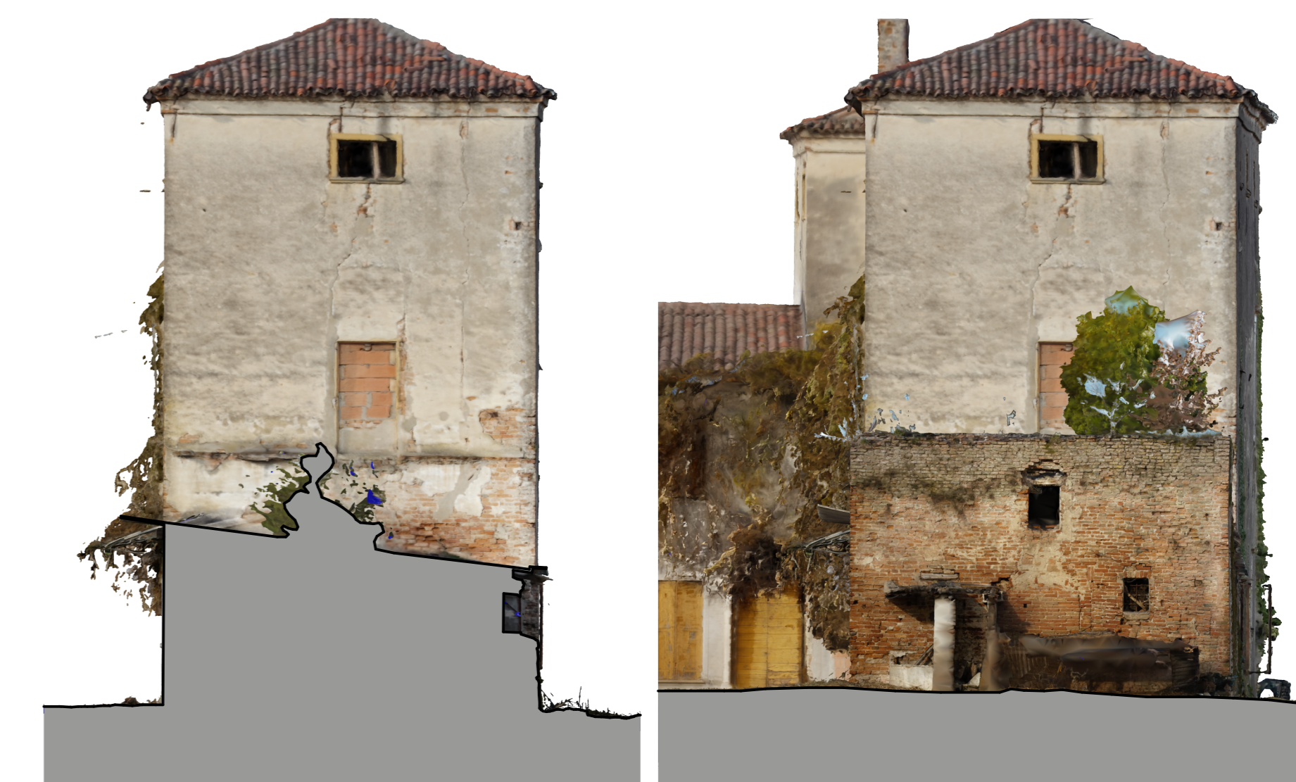
1:100 ORTOPROIEZIONE B2 ORTH003